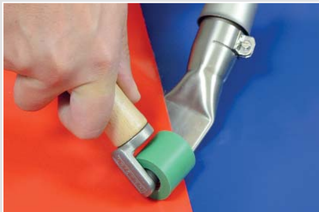
户外喷绘广告和工业篷布