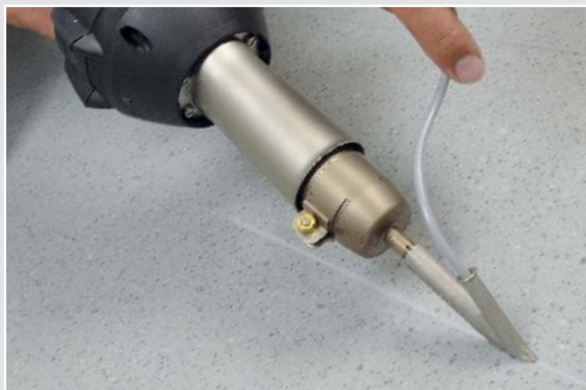
塑料和亚麻地板铺装