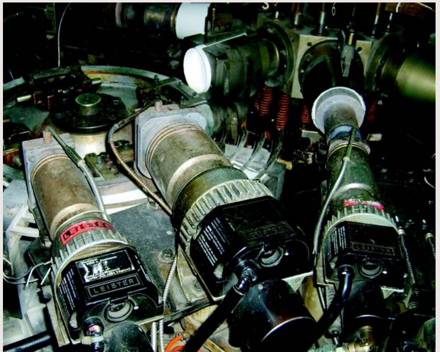
装配2只LE 10 000 S和1只LE 5000的生产线