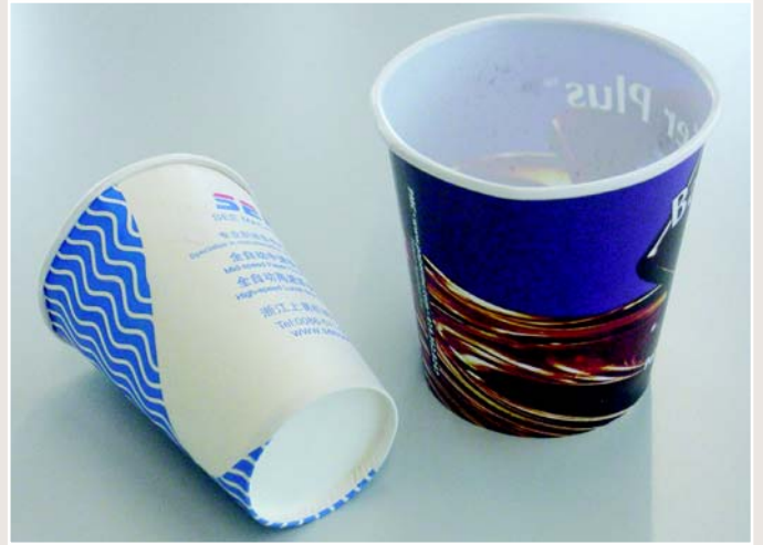
泰宝生产的两个样品 ..