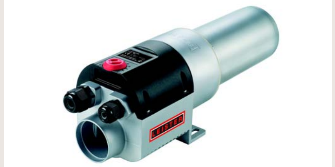
...可兼容的新款加热器 LHS 40 PREMIUM (2 - 4 kW 功率) 和 LHS 60 PREMIUM (5 - 16 kW).

客户: 中国重庆泰宝纸制品有限公司 设备制造厂商: 莱丹公司 销售服务商: 中国广州市迪涛焊接设备有限公司 文档制作: 莱丹公司/迪涛公司