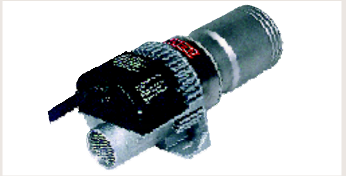
泰宝装配的旧款空气加热器LE 5000 和 LE 10 000 S...