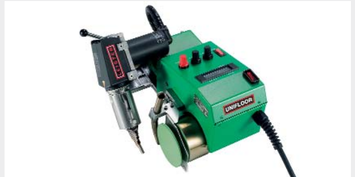
Heissluftschweissautomat Leister UNIFLOOR E