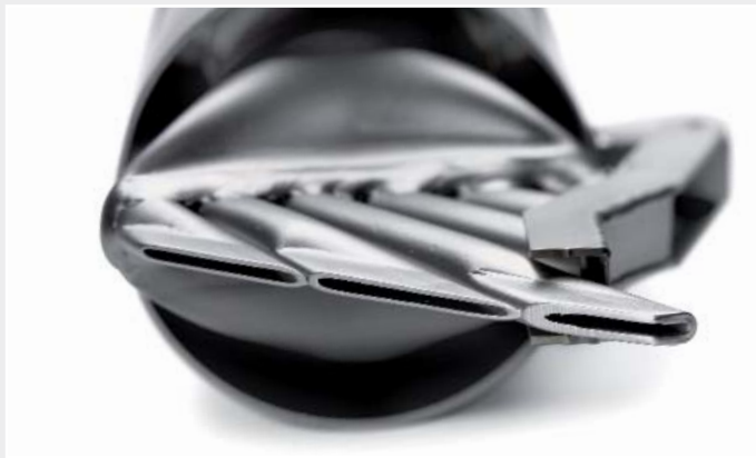
Die neue Air-Knife-Düse für den UNIFLOOR E ergibt einen messerscharfen Luftstrahl.

Um die Oberfläche nicht zu zerstören, muss ein sehr schmaler, heisser Luftstrahl direkt ins Zentrum der Nut gelenkt werden und die rückwärts fliessende Luft muss die Seitenflanken erhitzen. Kunststoff braucht Zeit, um die Wärme aufzunehmen. Um vernünftige Schweissgeschwindigkeiten zu erreichen, darf deshalb die Wärme nicht nur an einem Punkt, sondern muss über eine längere Strecke wirken. Air-Knife-Technologie heisst das Zauberwort: Ein messerscharfer Luftstrahl, der sehr präzise ins Zentrum der Nut gelenkt wird. Mittels dieses Luftstrahls ist es möglich, die inneren Flächen der Nut auf Schweissstemperatur aufzuheizen, ohne die PUR-Oberfläche zu zerstören. Dies funktioniert natürlich nicht nur beim Ziehschweissen von Hand, sondern auch bei den Schweissautomaten. Da die Vorwärmflut über mehrere Millimeter bei der Schnellschweissdüse bzw. mehrer Zentimeter beim Schweissautomaten wirken kann, sind wirtschaftliche Schweissgeschwindigkeiten möglich.