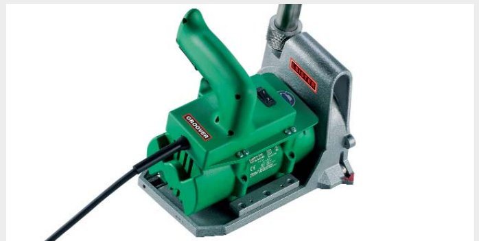
Fügenfräse Leister GROOVER

Präzise gefräste Schweissfugen und saubere Kanten sind ein Muss für qualitativ und auch optisch hochwertige Schweissverbindungen. Insbesondere bei PUR-Oberflächen muss darauf besonders geachtet werden. Mit dem Leister GROOVER lassen sich selbst harte Bodenbeläge optimal verarbeiten. Um allen Wünschen gerecht zu werden, steht ein breites Sortiment an Fräsern zur Verfügung.