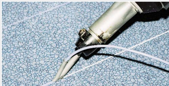
Schnellschweissdüse am Leister TRIAC PID für genaues Arbeiten.