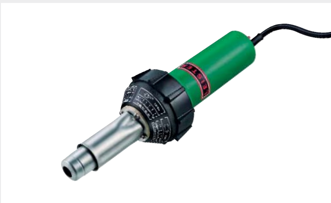
Handgerät TRIAC S

Projekt: Al Jaber Street Light Factory, Abu Dhabi, UAE Kunde: C. ILLIES & Co, Deutschland, www.illies.de Gerätelieferant: Leister Process Technologies, Schweiz, www.leister.com Verkaufs- und Servicepartner: BMC Gulf Trading & Contracting L.L.C., Dubai, VAE, www.bmc-gulf.com