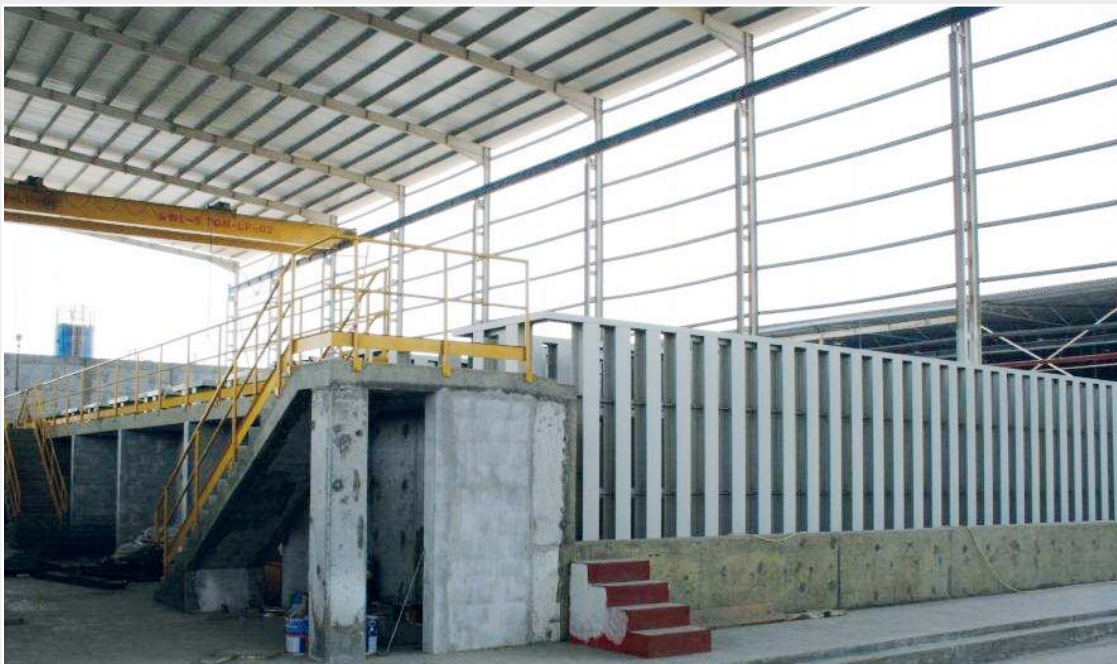
Die riesige Galvanisierungsanlage in der eigens dafür gebauten Halle.

Die Hamburger Firma ILLIES hat auf der ganzen Welt Vertretungen – genauso wie die Firma Leister Process Technologies. Dies war nicht zuletzt entscheidend, weshalb sich ILLIES entschloss, die Geräte des Schweizer Traditionsunternehmens zur Montage der Anlage einzusetzen. Dipl.-Ing.