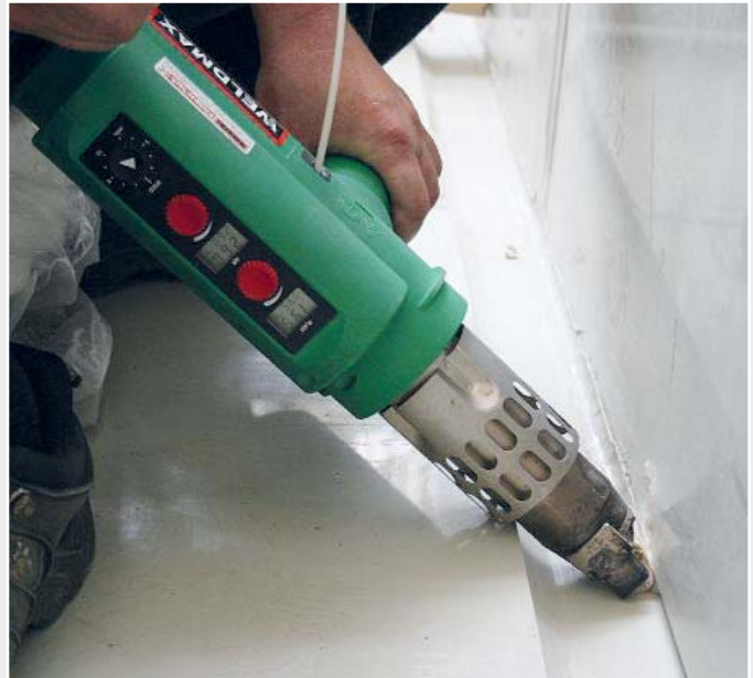
Hand-Extruder WELDMAX beim Schweißen einer Kehlnaht.

Für die Galvanisierungsanlage der neuen Al Jaber Street Light Factory in Abu Dhabi wurden zwölf riesige Kunststoffbecken gefertigt. Für deren Bau verarbeitete man über 100 Tonnen PP-Plattenmaterial. Mit der Fertigstellung dieser gigantischen Anlage wurde die Deutsche Firma ILLIES beauftragt. Die ersten Lichtmasten aus der neuen Fertigung wurden dringend benötigt. ILLIES hatte deshalb ein enges Zeitfenster einzuhalten. Im Mehrschichtbetrieb und unter den harten Bedingungen des Wüstensommers im Emirat wurde der bis zu 60 mm dicke Kunststoff mit Hand-Extrudern und Handgeräten von Leister geschweisst. Dies bei Aussentemperaturen von über 50 Grad Celsius. ILLIES hielt den Zeitplan ein. Heute werden in der fertigen Anlage stündlich bis zu 20 Tonnen Lichtmasten verarbeitet