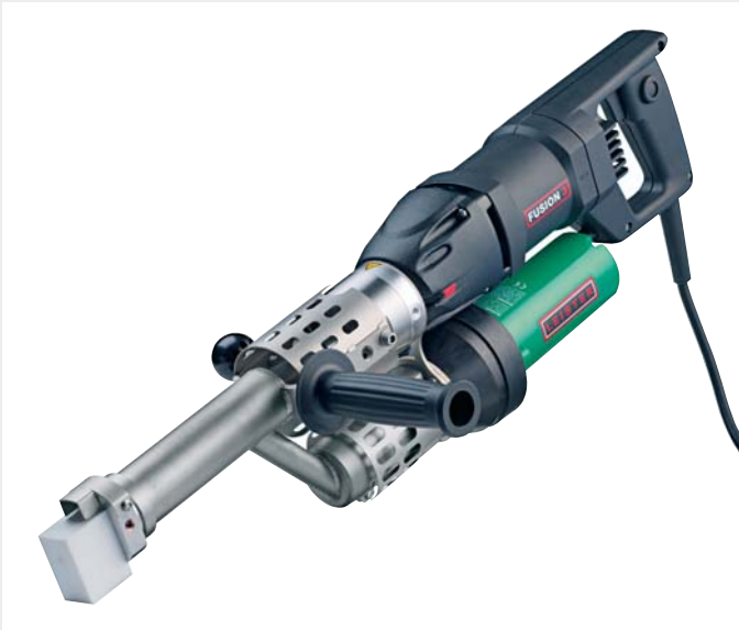
Hand-Extruder FUSION 3