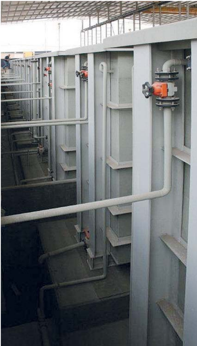
Die vielen Details waren besonders anspruchsvoll.

Leister produziert Hand-Extruder, welche stündlich bis zu 6 kg Extrudat ausstossen. In Abu Dhabi wurden aber die kleinen und handlichen FUSION 3 und WELDMAX eingesetzt. Dies vor allem der teilweise sehr engen Platzverhältnisse wegen. Trotz seiner bescheidenen Grösse schafft der FUSION 3 einen Ausstoss von bis zu 3 kg Extrudat pro Stunde. Der WELDMAX ist der kleinste Hand-Extruder von Leister. Er fand hier seinen Einsatz vorwiegend bei kniffligen Details. Das Handschweissgerät TRIAC S wurde auf der