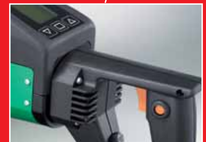
Ergonomischer Handgriff erleichtert das Schweißen in aufrechter Haltung