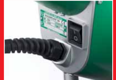
Vollständig geschlossenes und stabiles Gehäuse