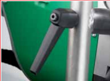
Symmetrische Handgriffaufnahme zur beidseitigen Befestigung