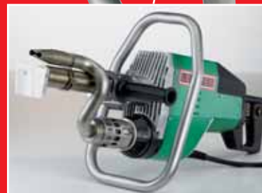
Flexibler Deponiegriff dient auch als Geräteablage