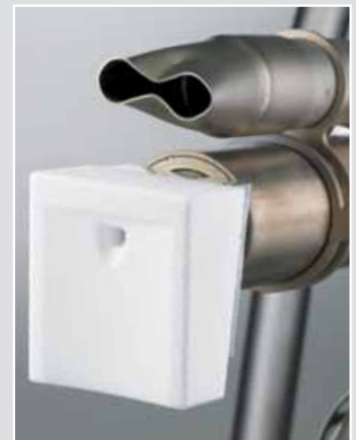
40 mm-High-Speed-Schweißschuh und leistungsstarke Vorwärmung

Leister steht für Zuverlässigkeit und Langlebigkeit