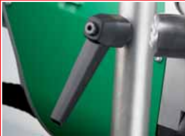
Symmetrische Handgriffaufnahme zur beidseitigen Befestigung