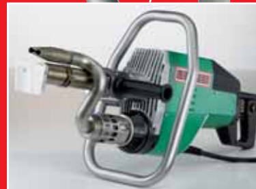
Flexibler Deponiegriff dient auch als Geräteablage