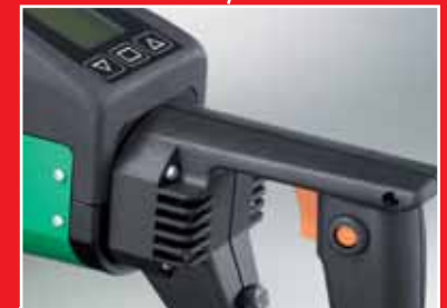
Ergonomischer Handgriff erleichtert das Schweißen in aufrechter Haltung