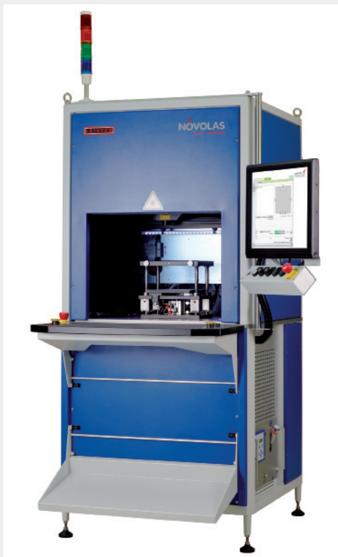
Novolas Workstation von Leister.

Um den hohen Anforderungen zu genügen hat Garmin ein Lasersystem aus der NOVOLAS Basic AT-Serie von Leister mit einem Bewegungssystem gekoppelt und in eine mobile Zelle eingebaut. Durch diesen Aufbau kann Garmin das Laserschweissystem nicht nur für seine Outdoor-Serie, sondern auch für Navigationsprodukte nutzen. Ein Produktwechsel ist einfach, der Austausch der Bauteilaufnahme und das Hochladen der Schweisskontur mit den Prozessparametern braucht wenig Zeit. Damit erhöht sich der Nutzen der Anlage um ein Vielfaches. Das früher angewandte Klebeprinzip erforderte längere Applikations- und Aushärtezeiten, dies ergab längere Zyklen. Die Aushärtezeiten entfallen beim Laserschweißen gänzlich. Dadurch sind die Übergabezeiten zwischen den Arbeitsschritten extrem kurz. Zudem konnte die Fügezeit durch das Laserschweissverfahren um nahezu 50 % reduziert werden. Die gegenüber dem Klebeprinzip höheren Investitionskosten des Lasersystems haben sich damit in kurzer Zeit amortisiert.