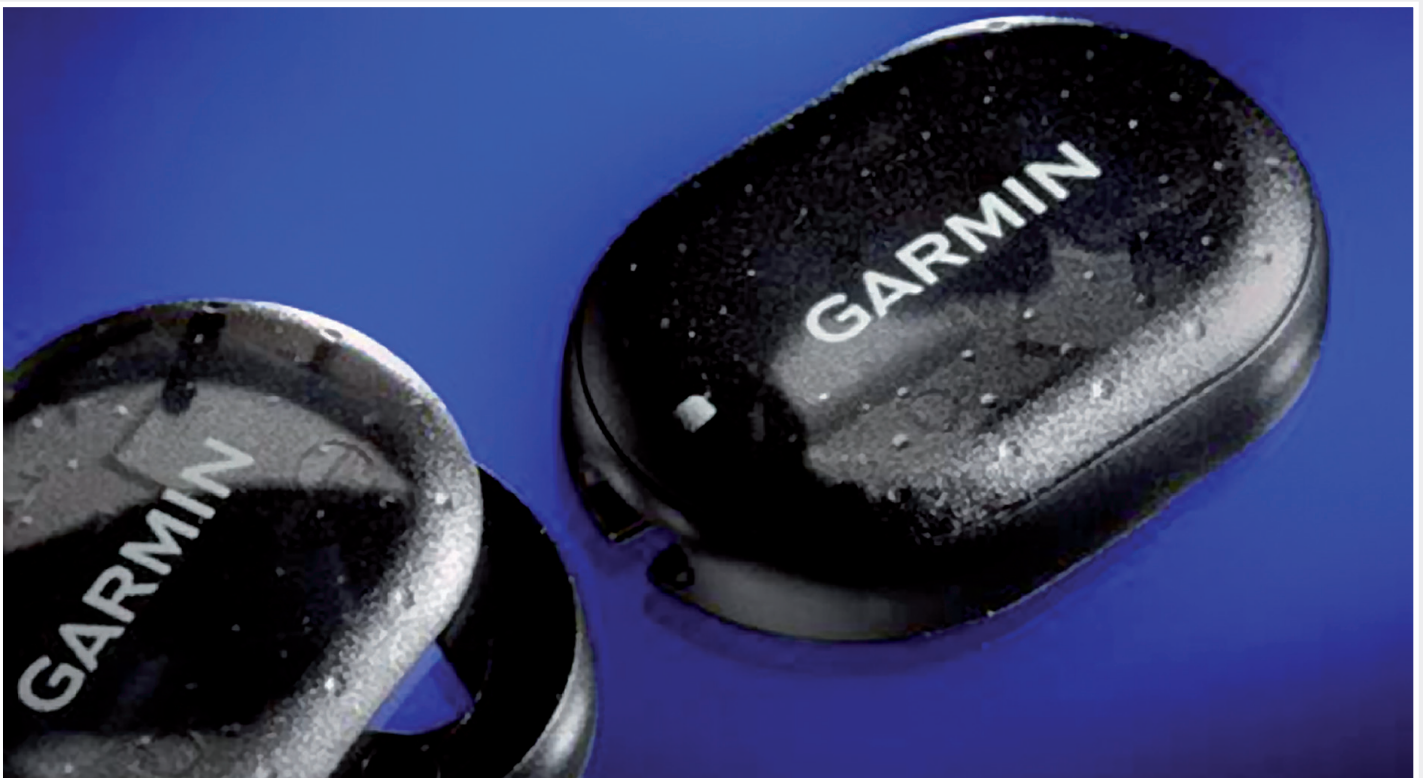
Foot Pod von Garmin.