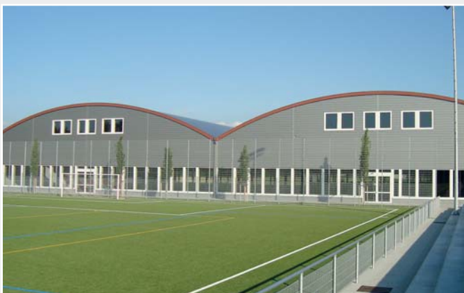
Die Doppelhalle beherbergt fünf Tennisplätze.

Die neue Doppelhalle ist gross genug, um 5 Tennisplätze, Gastgewerbeflächen und Konferenzräume zu beherbergen. Zwei Tonnendächer mit einer Gesamtfläche von 5000 m 2 ragen über das neue Bauwerk. Sie werden von einer massiven Holzkonstruktion getragen. Auf die darauf montierte Holzschalung wurde als Erstes eine Elastomerbitumenbahn als Dampfsperre gespannt. Darüber kam als Wärmedämmung 100 mm dicke Steinwolle zu liegen. Um die Dichtheit zu garantieren wurde schliesslich eine 1,8 mm dicke Kunststoffdichtungsbahn aus PVC verlegt.