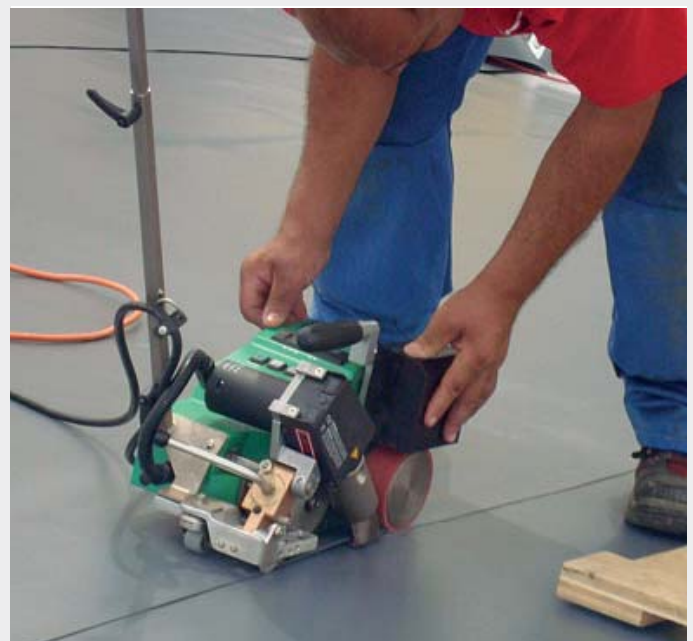
Dank seiner kleinen Abmessungen gibt es für den UNIROOF E keine Hindernisse.

schichtigen Dachaufbaus eine echte Herausforderung. Nochmals Herr Heiniger: „Wir sind mehr als zufrieden mit unserer Arbeit. Mit dem BITUMAT B2 hatten wir bei diesem 5000 m 2 -Dach die perfekte Alternative zur offenen Flamme. Mit dem Einsatz der Leister-Geräte gelang es uns, die Holzkonstruktion in kurzer Zeit und ohne Unterbruch absolut wasserdicht zu decken.“