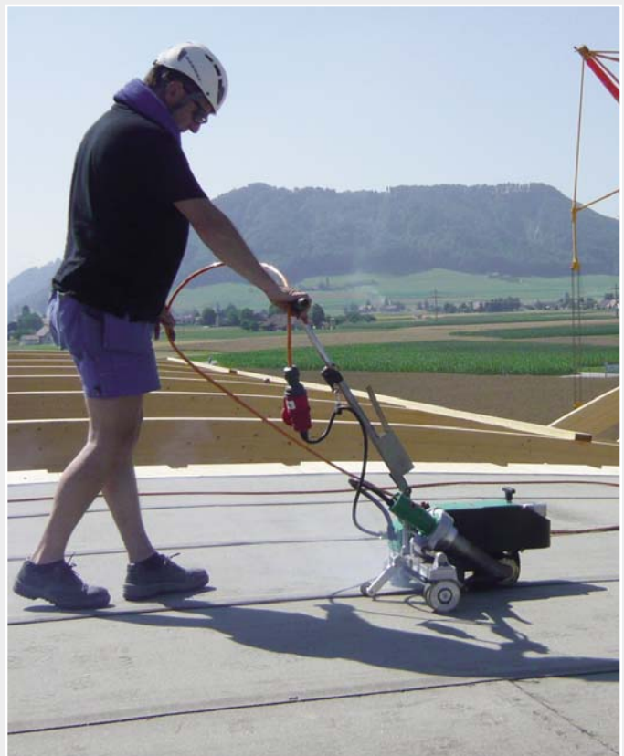
Einfache Geräteführung und sauberes Arbeiten mit dem BITUMAT B2.