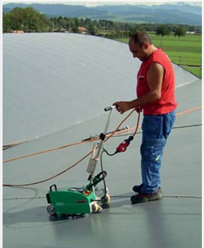
Der VARIMAT V2 – für schnelleres Verschweissen von Kunststoffdichtungsbahnen.

Für die Tennissasse, die jetzt in der Halle spielen, ist es selbstverständlich, dass sie das ganze Jahr unter einem trockenen Dach spielen können. Für die Verlegerfirma Gyger Flachdach AG hingegen war das Einsetzen des drei-