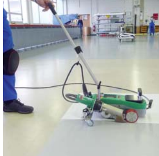
Soudures par recouvrement homogènes et sans pli