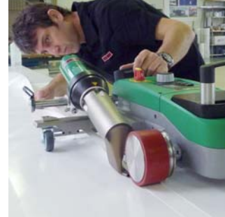
Soudage facile d'ourlets et de languettes à l'aide du kit ourlet/languette