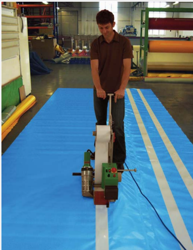
Intuicyjna i prosta obsługa