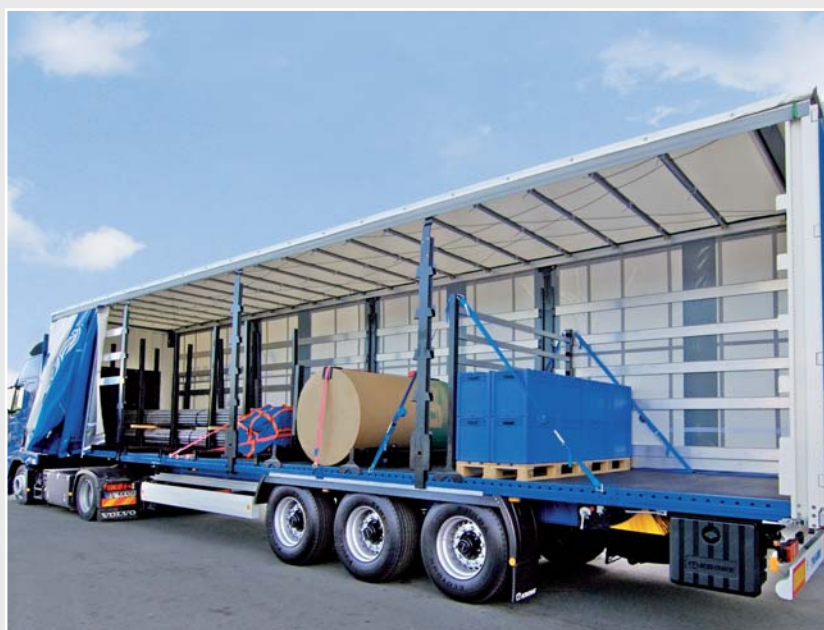
Pasy wzmacniające nad belkami